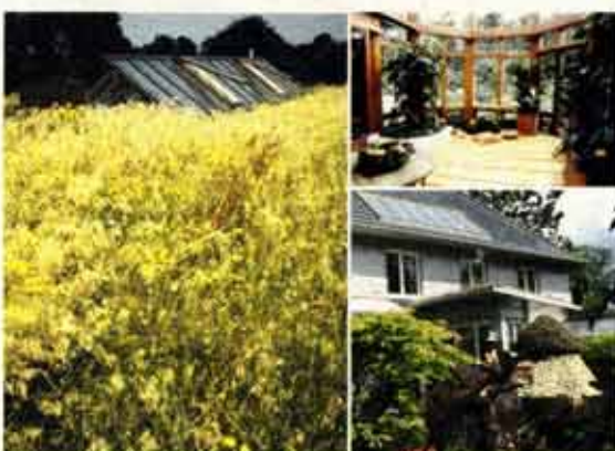
Aktive und passive Nutzung der Sonne

Hätten Sie gedacht, dass ökologisches Bauen so aussehen kann? Mehr unter: www.cousin-architekt.de