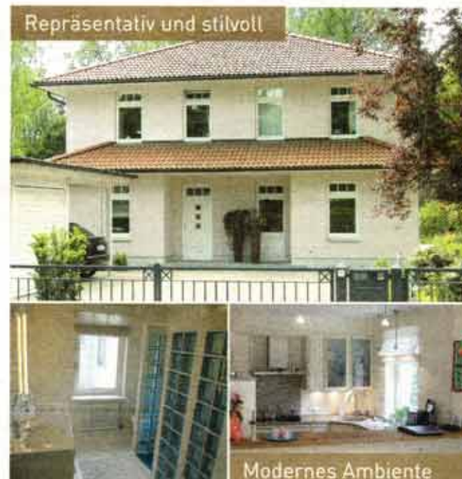
Repräsentativ und stilvoll